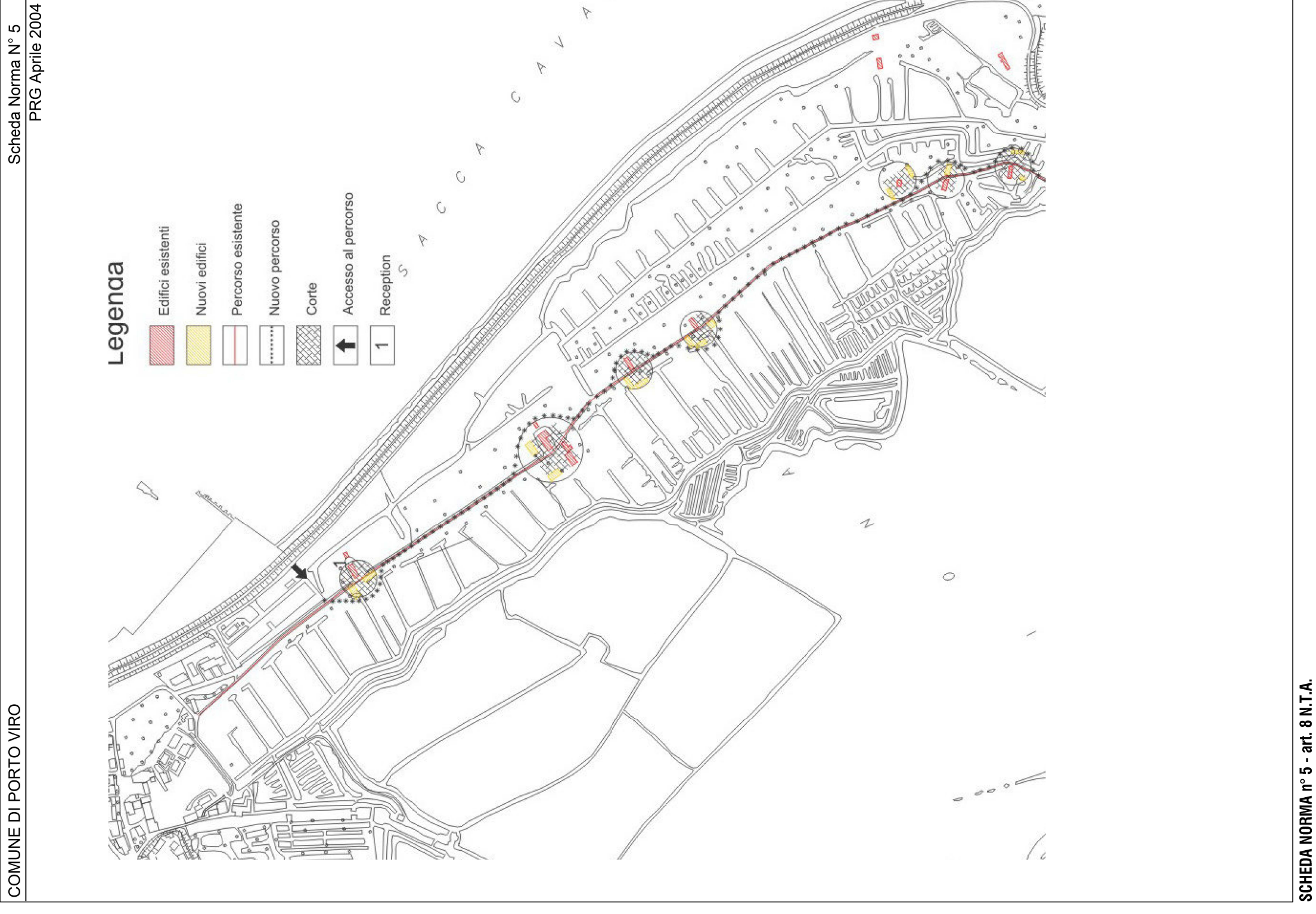
SCHEDA NORMA N° 5 - art. 8 N.T.A.