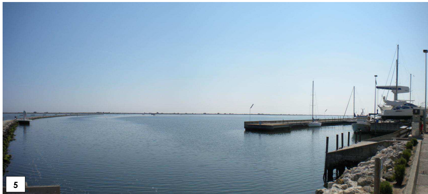
Porto Levante e Marina di Porto Levante